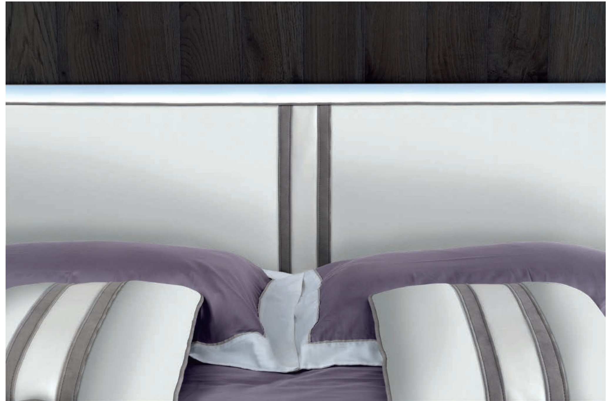
— VANITY LISCIO