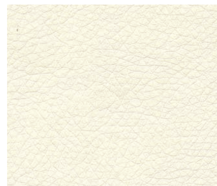
Eco leather WHITE

Стул Metrika: Каркас стула с подлокотником из хромированного металла, в обивке из эко-кожи белого, черного или серого цвета.