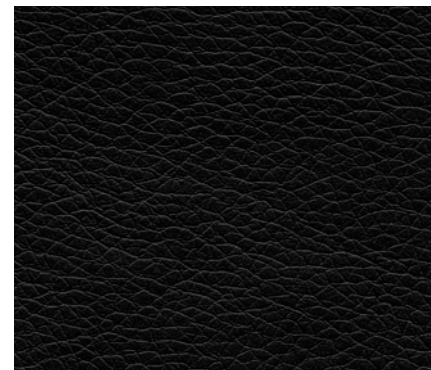
Eco leather BLACK