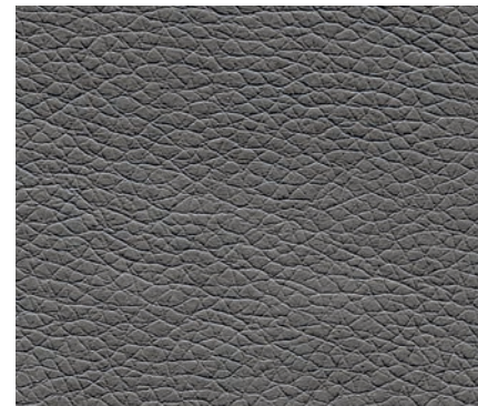
Eco leather GREY