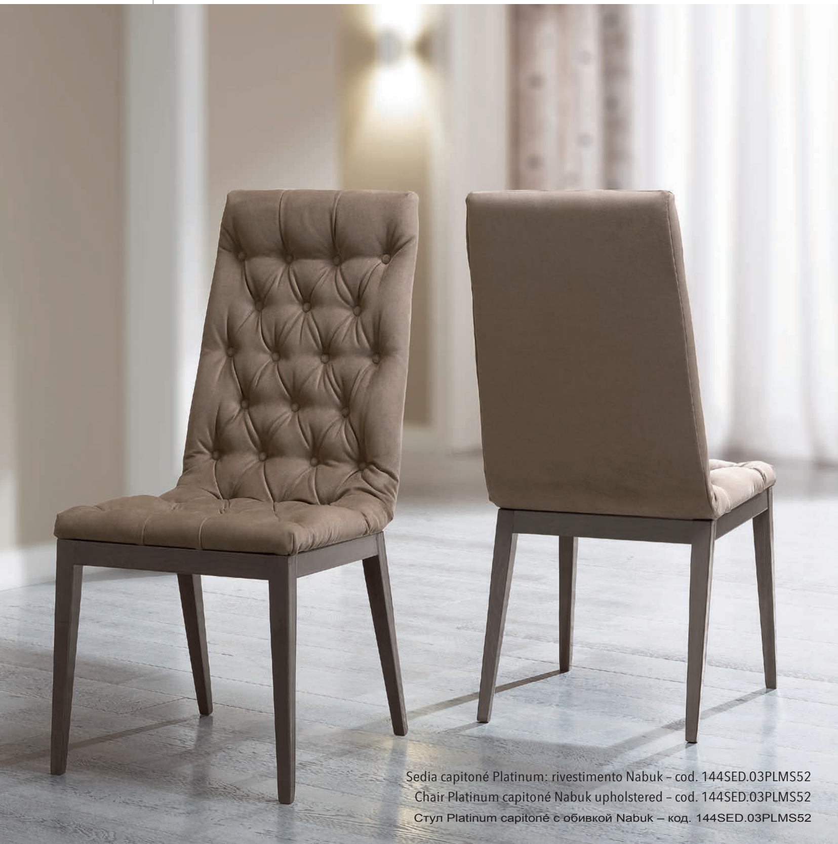
Sedia capitoné Platinum: rivestimento Nabuk – cod. 144SED.03PLMS52 Chair Platinum capitoné Nabuk upholstered – cod. 144SED.03PLMS52 Стул Platinum capitoné с обивкой Nabuk – код. 144SED.03PLMS52

Sedia Platinum – Legno di faggio massello, verniciatura con quattro passaggi di vernice a poliestere, lucentezza 100 gloss, inserto in cromo. Made in Italy by Camelgroup.