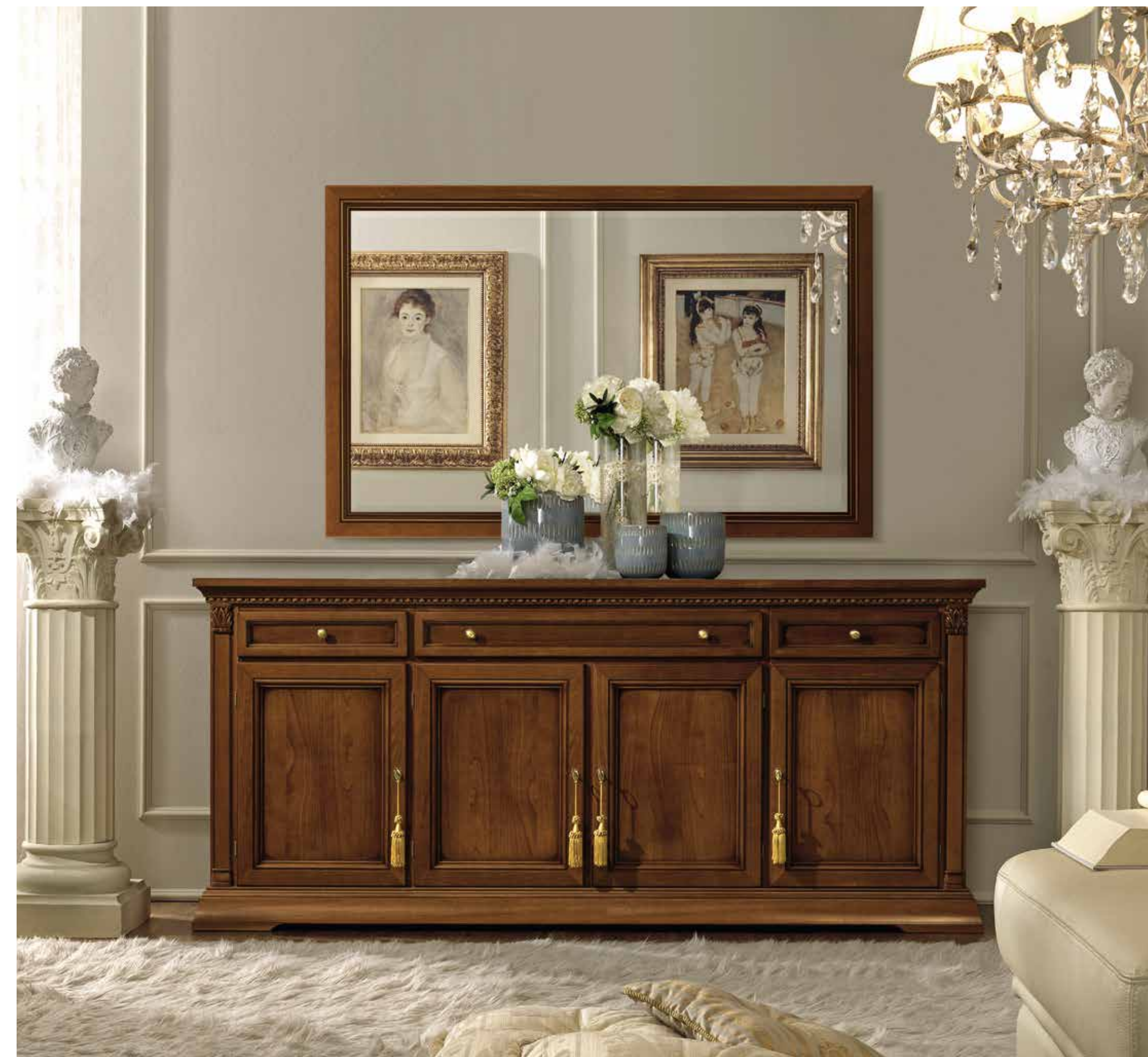
Credenza a quattro ante.